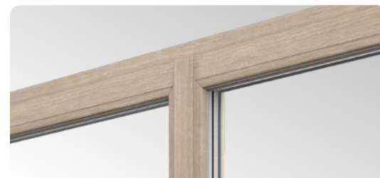
Slanke profiler med en smal midtstolpe er utstyrt med dobbel tetning, som er en innovativ løsning på markedet.