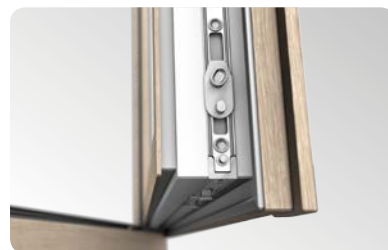
Høykvalitets Maco Multi Beslag KS leveres med to innbruddsikre plugger som standard.